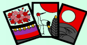
花札で楽しいひと時 赤短・青短・猪鹿蝶 役は、できたのでしょうか